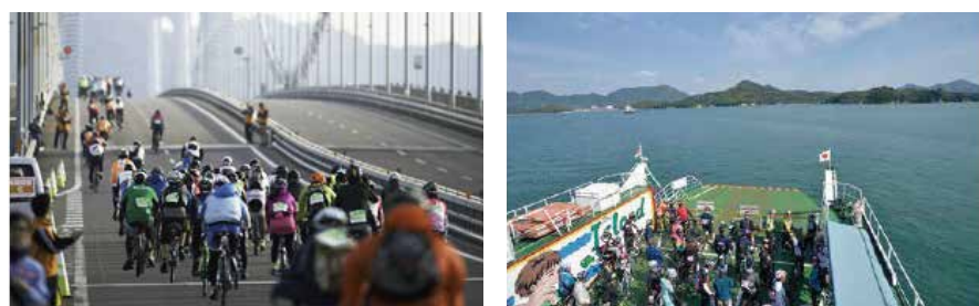
※引用は「サイクリングしまなみ2022」のホームページ、パンフレットより