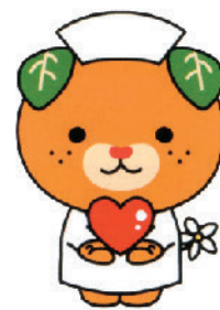
愛媛県イメージアップキャラクター みきやん

2019年から工事に着手していましたが、このほど屋上ヘリポートを有し、これまで分散していた診療機能を集約し、免震構造の6階建て病棟が完成し、県民の命を守るための使命を果たす充実した待望の診療が開始されます。