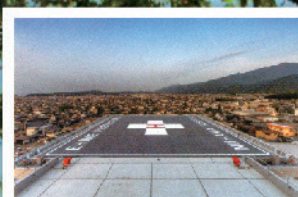
災害に強い機能 屋上ヘリポート (従来の地上ヘリポートも 同時運用)

2021年8月1日(日)に 新診療棟がオープン 8月2日(月)から外来診療をスタート